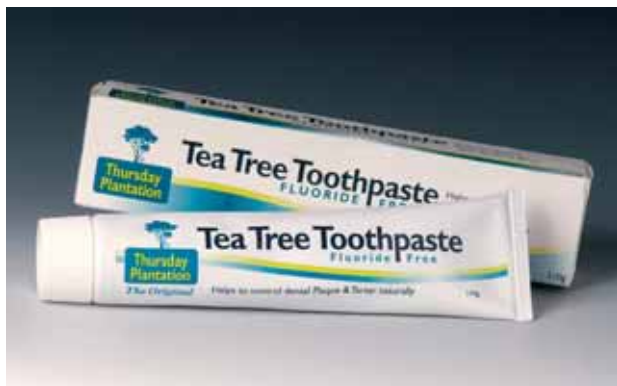
Abbildung 1 Teebaumöl (Tea Tree Oil) ist in Australien ein bekanntes Hausmittel zur Wundbehandlung und wird auch als antiseptischer Zusatz in Zahncremes eingesetzt. Die antimikrobiellen und antiinflammatorischen Eigenschaften der ätherischen essentiellen Öle sind interessant für die Behandlung periimplantärer Infektionen.

Figure 1 Tea tree oil is a common wound care antiseptic in Australia and is also used as an antimicrobial ingredient in toothpastes. The antimicrobial and anti-inflammatory effects of essential oils may be advantageous in dental implantology. (Abb. 1-2: P. H. Warnke)