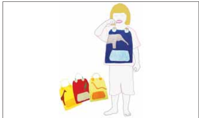
Abbildung 4 Variationen der Handtuchschürze. Figure 4 Variations of the towel-apron.

anderen Perspektive, sowohl physisch als auch psychisch. Mit drei Jahren sind die wichtigsten motorischen Fähigkeiten voll ausgebildet [10]. Allerdings sind Kinder bis zum siebten Lebensjahr noch nicht in der Lage, die feinmotorischen Bewegungen der Hand zu koordinieren, z. B. um richtig Zähne zu putzen [6, 10]. Erst ab sechs Jahren beherrschen Kinder beinahe die gleichen Bewegungen wie Erwachsene [11]. Die psychische Entwicklung dagegen dauert wesentlich länger. In ihrer Wahrnehmung und der Art zu denken, fehlt Kindern noch jahrelange Erfahrung, bis sie sich den Erwachsenen annähern [10]. Die kindliche Sichtweise ist bis zum vierten Lebensjahr vor allem ichbezogen [2, 11]. Eine differenzierte Trennung zwischen Umwelt und Ich entwickelt sich erst allmählich. Daher ist es üblich, dass Gegenstände um sie herum Charakterzüge bekommen, die aus dem eigenen Leben übernommen werden.