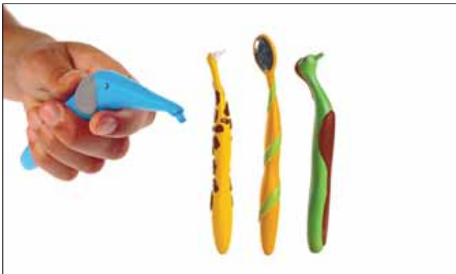
Abbildung 3 Prophylaxe-Spielgeräte für zu Hause. Figure 3 Playing equipment for prophylaxis at home.