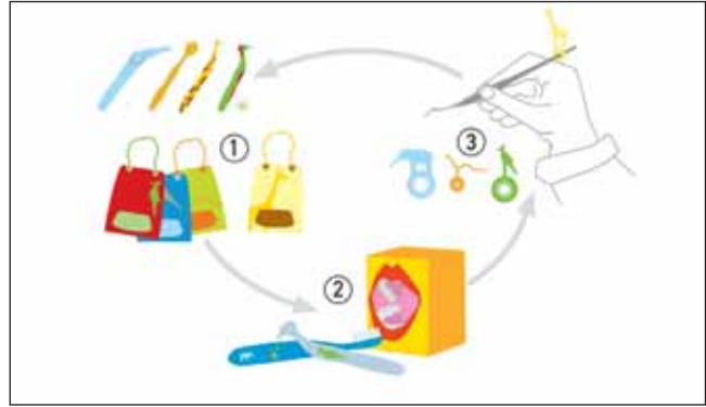
Abbildung 2 Zahnpflegenetzwerk: 1: zu Hause, 2: im Kindergarten, 3: beim Zahnarzt. Figure 2 Dental-care network: 1: at home, 2: in the kindergarten, 3: at the dentist's.