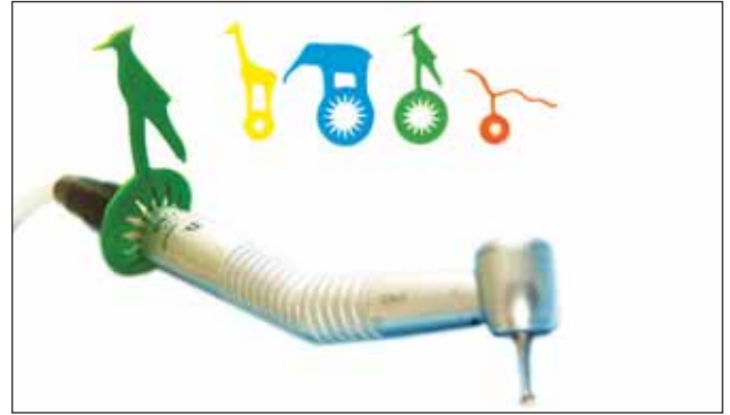
Abbildung 6 Specht-Aufsatz für den Bohrer und Instrumentenaufsätze, Größe ca. 6 cm. Figure 6 Woodpecker top for the drill and instrument tops, size ca. 6 cm.

hat; hier ist die gründliche Pflege vorrangig. Zweitens die Prophylaxe im Kindergarten, die vorrangig spielerischer Natur ist. Den dritten Bereich bildet die Zahnarztpraxis.