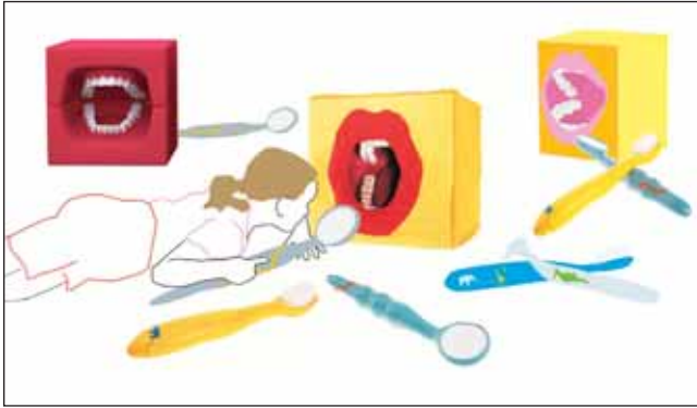
Abbildung 5 Spielwürfel: Würfelaußenmaß 32 x 32 cm, Geräte ca. 45 cm lang. Figure 5 Playing cube: overall dimensions 32 x 32 cm, equipment ca. 45 cm long.