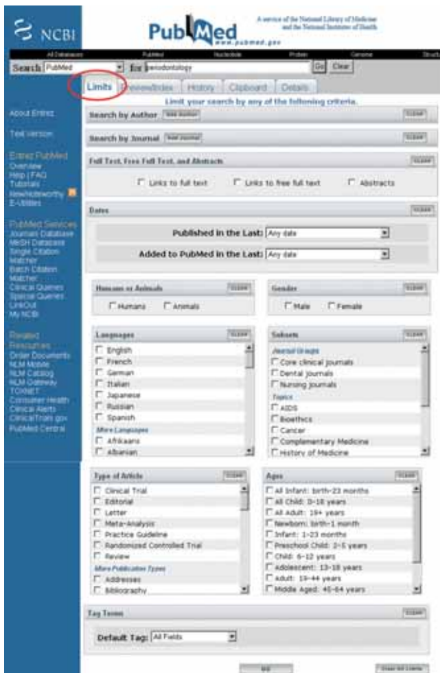
Abbildung 1 „Limits“-Seite mit den Auswahlmöglichkeiten zur Eingrenzung der Suche.

Falls Sie zu Periodontology Artikel von einem bestimmten Autor oder aus einer bestimmten Zeitschrift suchen, können Sie durch Anklicken von „Add Author“ oder „Add Journal“ einen gewünschten Namen bzw. eine Zeitschrift markieren, wenn nach Eintippen der ersten Buchstaben im Auswahlfenster das Zutreffende angeboten wird. Sind Ihnen die Initialen des Vornamens nicht bekannt, klicken Sie lediglich auf den Nachnamen. Mit „Add Another Author“ bzw. „Add Another Journal“ können weitere Autoren und Zeitschriften hinzugefügt werden. Bei mehreren Autoren haben Sie die Wahl, nach allen Au-